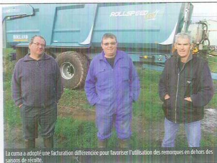
La cuma a adopté une facturation différenciée pour favoriser l'utilisation des remorques en dehors des saisons de récolte.

Afin de favoriser l'utilisation de ces remorques en dehors des saisons de récolte, la cuma a adopté un système de facturation différenciée. En périodes